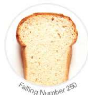
Falling Number 250