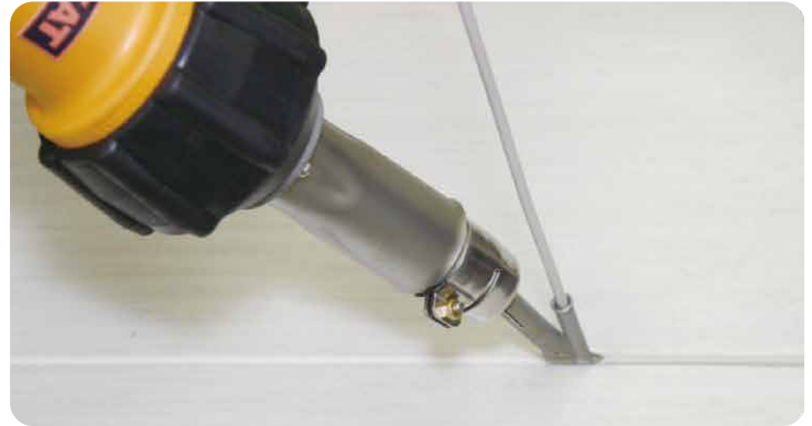
床用シートの目地溶接