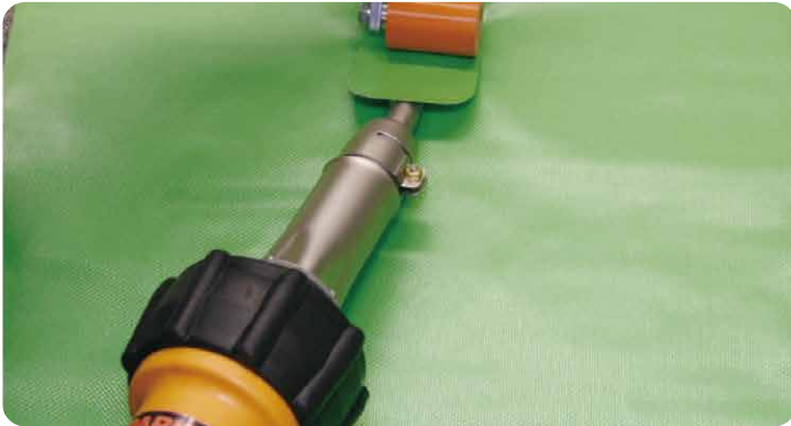
テントシートの幅接ぎ・補修