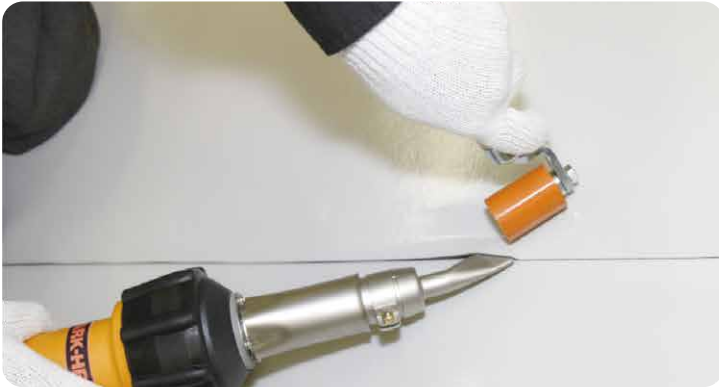
防水シートの重ね合わせ溶接